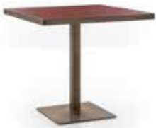
Table de bar avec top et base carrés. En métal verni noir ou finition bronze/satinée. Top plaqué ou en contreplaqué recouvert de laminé, disponible aussi avec un rebord périmétral en finition bronze.

Bar table with square top and base. In black painted metal or with bronze/satin finish. Veneer or plywood top covered with laminate, also available with perimeter ring in bronze finish.